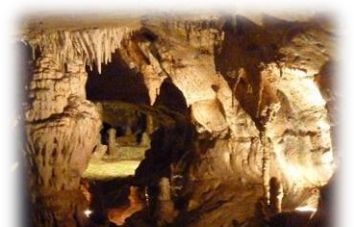
Visite des grottes (renseignements au musée)