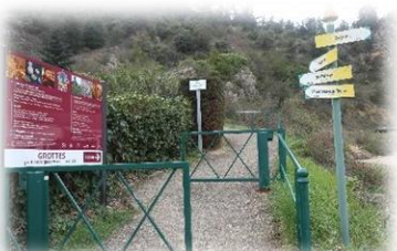
Sentier botanique, sentiers de randonnées et de la Tour