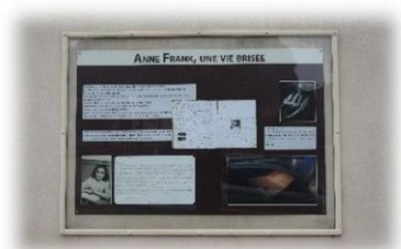
Exposition permanente Anne Franck (place de l'école)